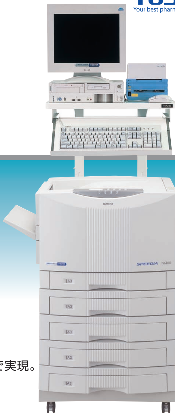
専用架台、ラベルプリンター（オプション） 専用架台と組み合わせることにより省スペース化が図れます。

エコロジー&エコノミー。 高い環境性能や経済性という品質。 調剤業務に求められる性能を カラー33枚／分、モノクロ38枚／分で実現。