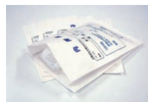
ガゼット薬袋 マチ付き

必要な薬袋印刷を速やかにプリントしたいという調剤業務に対応。印刷スピードをさらにアップし、A4サイズでフルカラー33枚／分、モノクロ38枚／分の高速連続印刷を実現しました。